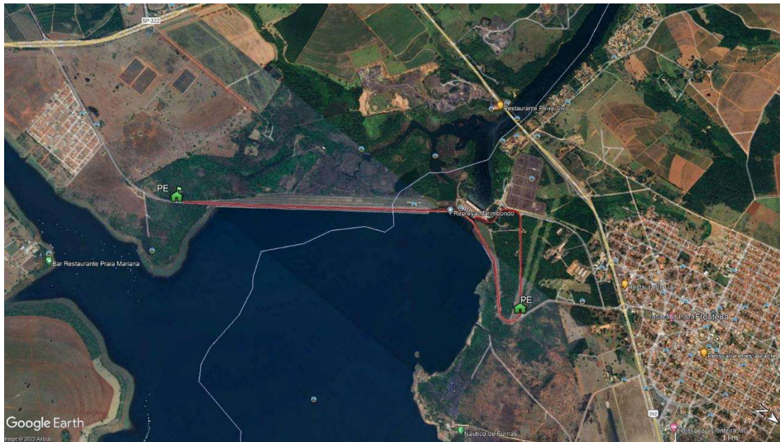
Figura 1 – PEs e RF da UHE Marimbondo.

A Figura 1, a seguir, apresenta os pontos de encontro e rotas de fuga deste empreendimento, que se encontram também em KMZ.